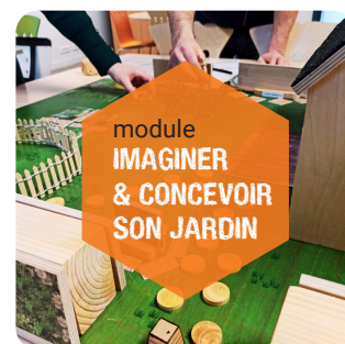
Imaginer et concevoir son jardin : VM : 2 500€ / VN : 500€