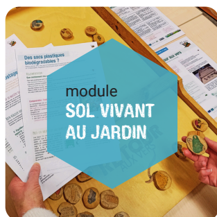
Sol vivant au jardin VM : 2 400€ / VN : 500€