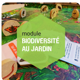
Biodiversité au jardin VM : 1 100€ / VN : 500€

La malle peut être achetée dans son ensemble ou par module. Les tarifs sont nets de taxes. La version matérielle (VM) est un achat complet clé en main, avec toutes les activités fabriquées et imprimées. La version numérique (VN) regroupe l'ensemble des fichiers graphiques à reproduire par vos soins, avec un cahier des charges des éléments techniques de production.