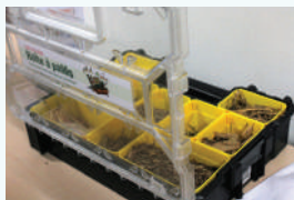
"Boîte à paillis"

Outils pédagogiques Activités Outils de jardin Fiches ressources