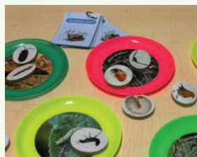
"Qui mange quoi ?"