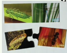
"Faites la paire"