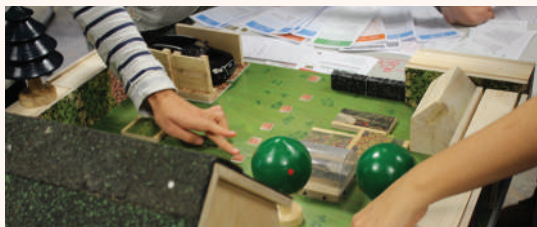
"Imaginer son jardin"

Activité de conception de jardin Photolangage Fiches ressources