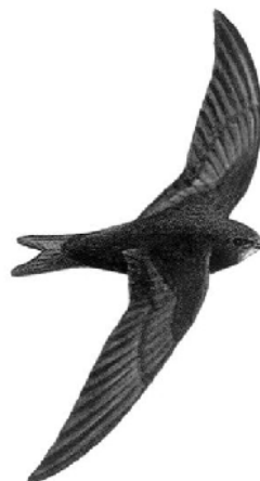
Martinet noir

Tout noir, grands ailes en forme de faux, vole souvent en hauteur en poussant des cris aigus.