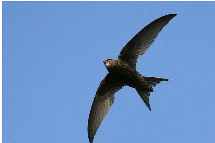
Martinet noir

Pas de nid visible. Il faut le surprendre à l'entrée d'une anfractuosit  dans un mur, sous un toit pour rep rer une nidification (cet oiseau ne se pose jamais en dehors de la nidification !).