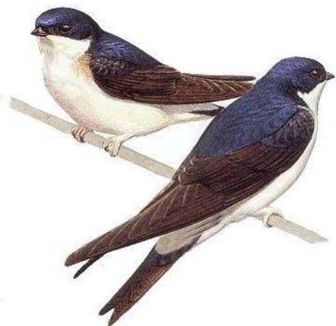
Hirondelle de fenêtre - © LPO Vienne

Croupion et ventre blancs, dessus bleu métallique foncé