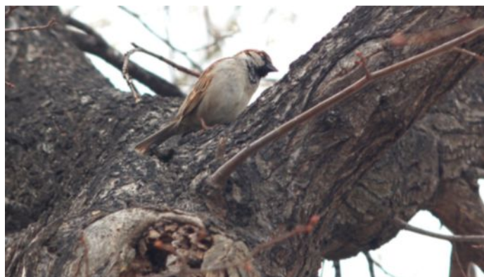
Moineau domestique m le- © D. Galiana

Le nid est en forme de d me avec une ouverture sur le c t , constitu  d'herbe s ch e, de paille, de plumes, de poils. Il peut se situer dans un trou d'un b timent, dans des anciens nids de corneilles, dans les branches d'un arbre.