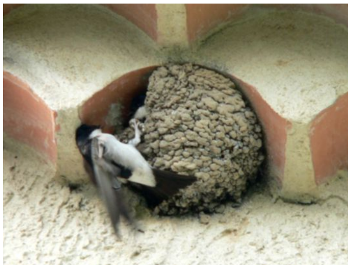
Hirondelle de fenêtre

À l'extérieur des bâtiments au niveau des angles des fenêtres ou des avancées de toit. Nids de forme ronde en couches de boue successives avec une encoche comme entrée. Pas de brin d'herbe apparent.