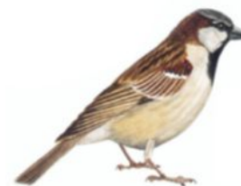
Moineau domestique mâle

Souvent au sol, en petits groupes. Le seul de 4 espèces à être présent toute l'année.