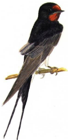
Hirondelle rustique

Gorge rouge brique, ventre blanc et dessus du dos ardoisé, queue très fourchue.