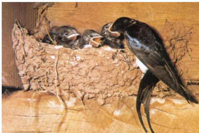
Hirondelle rustique - © L. Chopin

À l'intérieur des bâtiments (granges, garages, parkings souterrains, préaux...). Nids en couches de boue avec des brins d'herbe apparents, le haut du nid n'est pas collé au plafond.