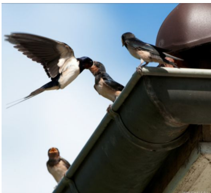
Hirondelle rustique