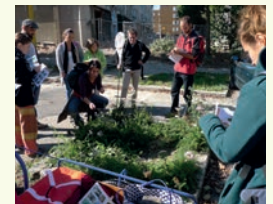
Formation sur la nature en ville dans le quartier Cleunay à Rennes