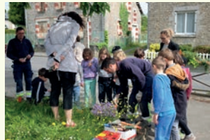
Photo ci-contre : Plantation en pied de mur avec les élèves de l'école publique les agents communaux de Saint-Aubin du cornier

Bretagne Vivante a développé une offre régionale de formations professionnelles dans les domaines de l'éducation à l'environnement, la gestion des milieux semi-naturels et naturels et de l'expertise naturaliste.