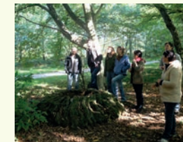
Formation « Animer sur l'arbre » à Rennes

Nous accompagnons les animateurs à s'appuyer sur la nature et leur environnement immédiat pour construire des projets et activités pédagogiques avec leurs publics.