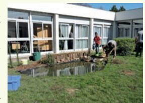
Photo ci-contre : Mare réalisée par des élèves de 6ème et 5ème du collège Thérèse Pierre de Fougères